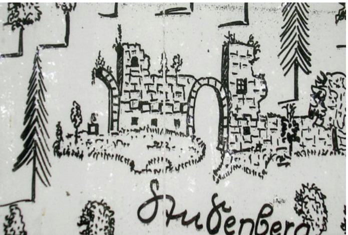
Der Holzschnitt zeigt die Stufenburg um 1770.